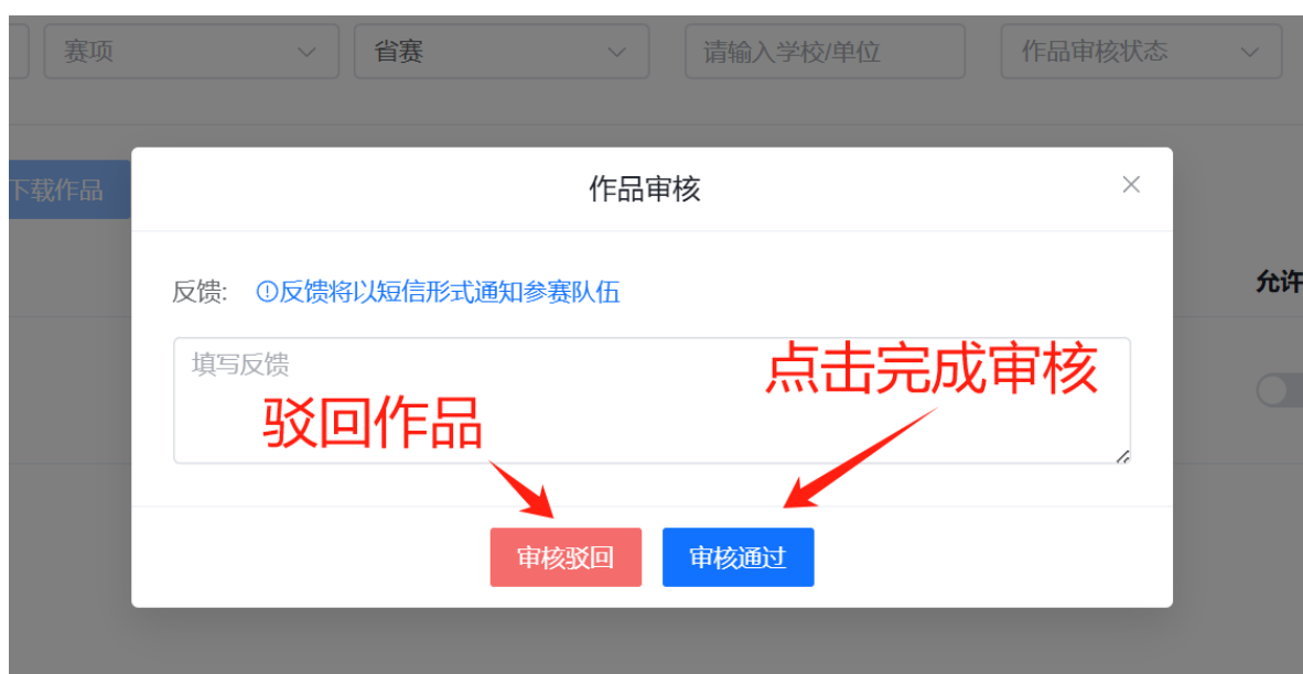
图 6 作品审核