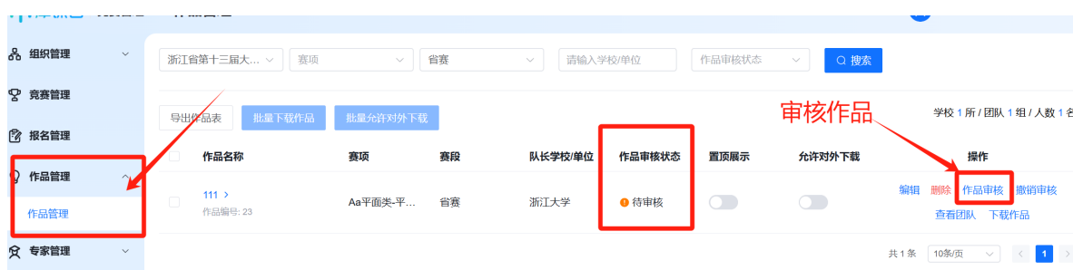
图 5 作品管理列表

2. 若“报名管理”中有团队信息，但“作品状态”栏中无相应作品，则表示该团队仅报名，尚未提交作品，请及时联系团队队长提交作品。