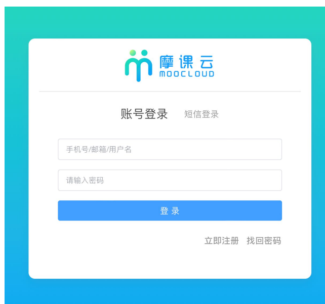
图 2 登录

2、登录网址： https://cp.moocollge.com/ 。（如图 2）